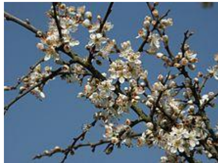
Endrino en flor.

El endrino es un arbusto de hoja caduca, de ramas espinosas, que suele alcanzar de 2 a 3m de altura.