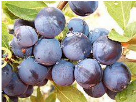
Endrinas en el arbusto.