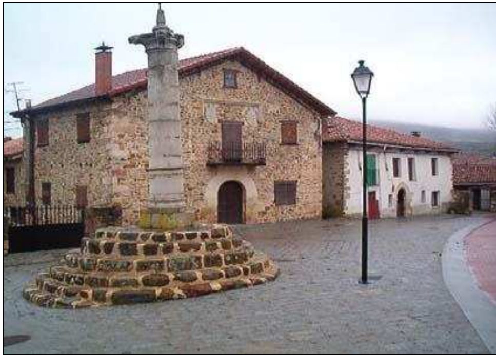
PLAZA DEL ROLLO EN SAN SALVADOR DE CANTAMUDA

En el Parque desde su declaración y hasta el año 2009 se ha mantenido otra línea de ayudas de la Consejería de Medio Ambiente que tenía como destinatarios a los propietarios particulares de casas o naves y otras instalaciones ganaderas.