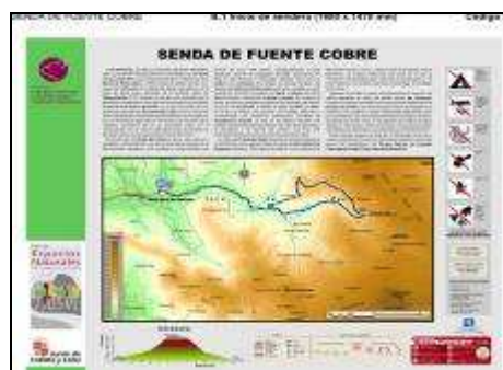
PANEL DE LA SENDA DE FUENTE COBRE

Otra actuación importante fue la construcción de una pasarela peatonal y adecuación de plaza y paseo en San Salvador de Cantamuda por un importe de 144.272,97€. Se trata de la construcción de una pequeña plaza delimitada con un muro de piedra, y el arreglo y ajardinamiento de la margen izquierda del río desde el puente viejo hasta la nueva pasarela. La pasarela, de madera laminada facilita el acceso a la Colegiata .