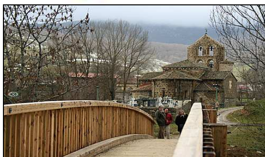
PASASERA DE SAN SALVADOR DE CANTAMUDA

Otra actuación importante fue la construcción de una pasarela peatonal y adecuación de plaza y paseo en San Salvador de Cantamuda por un importe de 144.272,97€. Se trata de la construcción de una pequeña plaza delimitada con un muro de piedra, y el arreglo y ajardinamiento de la margen izquierda del río desde el puente viejo hasta la nueva pasarela. La pasarela, de madera laminada facilita el acceso a la Colegiata .