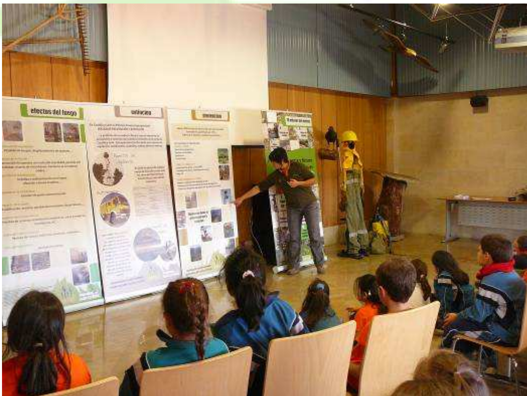
Alumnos de Educación Primaria atendiendo las explicaciones sobre incendios forestales previas al "Juego del Explorador del Bosque"