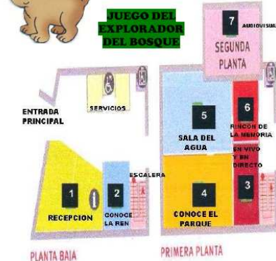
LA MAQUETA DEL PARQUE

¡¡¡ HOLA!!!! Bienvenidos a la CASA DEL PARQUE FUENTES CARRIONAS Y FUENTE COBRE – MONTAÑA PALENTINA. Te acompañaré durante el tiempo que dure tu visita a la casa. ¡¡Huy!! No me he presentado Yo soy, el OSO MANOTAS