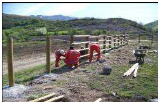
MANGA GANADERA DE STA. MARIA DE REDONDO

En estos diez años, para el Parque ha sido igualmente importante la mejora paisajística en este caso del municipio de la Pernía, y a ello también se han dedicado esfuerzos por medio de la cuadrilla. En este sentido se ha actuado la mejora de la manga ganadera de Santa María de Redondo en la que se sustituyeron los elementos metálicos por madera, y se ha retirado numerosos carteles en desuso o abandonados, que tanto afean el paisaje cuando se deterioran.