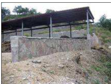
ABONEROS DE STA. MARIA DE REDONDO

En esta misma localidad se han edificado unos aboneros para que sean utilizados por los ganaderos de la localidad para almacenar el estiércol, y poder retirar el que se almacenaba al inicio de la senda. Estas actuaciones de construcción de infraestructuras de uso público ha supuesto una inversión del Parque en la Pernía de más de 260.000€.