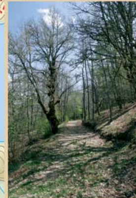
Entre Risosa y Carande la ruta atraviesa un precioso robledal en el que se entremezclan robles albares y rebollos.