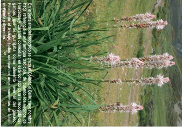
En la parte alta del recorrido se cruza al Collado el Baile, cuyo nombre hace referencia a una antigua vertiente de collado por donde se recolectan las Horcadas. Durante comedia en este collado para la recogida de la miel, que se guardaba como alimento invernal del ganado. Finalizado el trabajo, todos compartían unos momentos de baile, merienda y diversión.