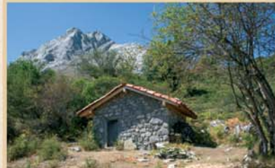
El chozo de Risosa es un refugio de pastores restaurado que puede brindar asistencia al senderista.