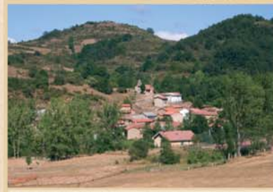
Dominando el caserío de Horcadas, la iglesia de San Cornelio y San Cipriano, de los siglos XIV a XVI, está declarada Bien de Interés Cultural.