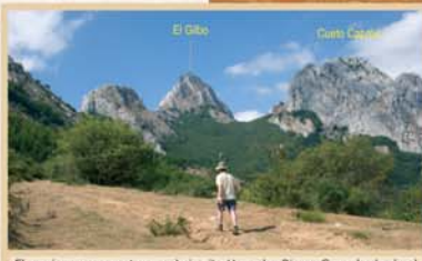
El camino que conecta con el circuito Horcadas-Risosa-Carande desde el área recreativa de Las Viescas discurre a través del precioso hayedo de Canal Moro.