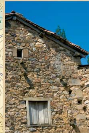
Asentado en una suave pendiente que termina en el pantano de Riño, Carande esconde detalles valiosos de arquitectura rural.