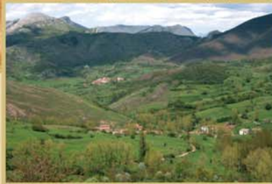
La subida al Alto de las Camperas ofrece una buena panorámica sobre las amplias vegas de Primajas y Viego, rodeadas de montes alomados y peñas calizas.