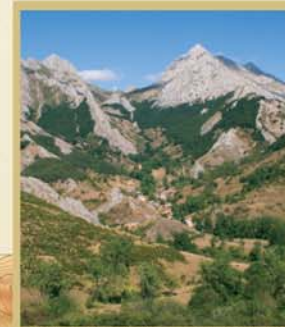
Desde el camino de Viego se disfruta de una estupenda panorámica sobre el pueblo de Salamón, situado a los pies del collado de Anciles, que separa las puntiagudas cumbres del Pico Llerenas, al oeste, y Las Pintas, al este.