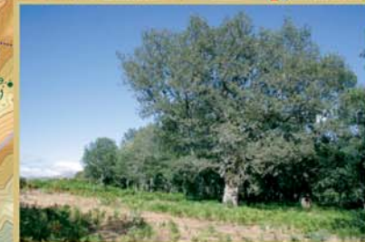
La Majada de Prado Pando es un amplio pastizal rodeado de bosque, adeshado en su parte más alta con grandes rebollos.