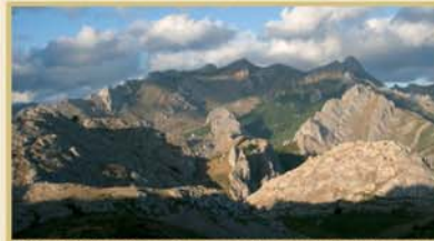
Desde el Collado de Viego se abarca una confusa sucesión de crestones calizos y se intuye la angostura de la Hoz del río Dueñas por la que discurre la carretera entre Salamón y Lois.