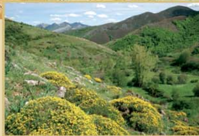
En el valle de Primajas, allí donde la cabecera se ensancha entre empinadas laderas de haya, monte bajo y pastizal, existió un pueblo con el mismo nombre.