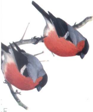
La senda del

Nada más dejar atrás las últimas casas de Camposolillo y tras salvar el paso canadiense que limita el tránsito del ganado hacia los pastos, la ruta se desvía a la derecha por una pista forestal que se encarama un poco en las faldas del Susarón, evitando así las periódicas inundaciones que se producen cada vez que sube el nivel del embalse. Esta pista va ganando altura progresivamente hasta que, al doblar una loma con buenas vistas del entorno, comienza un suave descenso hacia