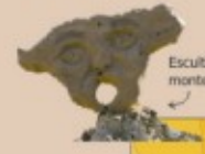
Esculturas en el monte de Valle