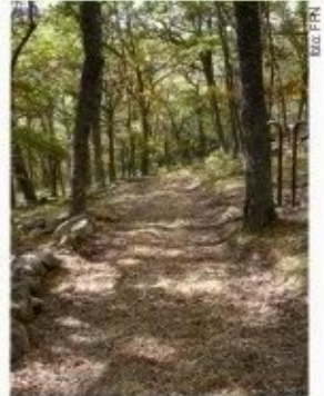
Arriba: paso del Alto de los Castillos; Abajo: gran parte de la ruta discurre por el interior de hermosos bosques de rebollo.