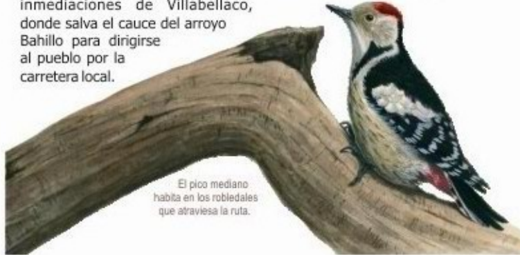
El pico mediano habita en los robledales que atraviesa la ruta.

La Senda del escultor "Ursi" es mucho más que una ruta de senderismo. Concebida como homenaje póstumo al artista local Ursicino Martínez, es en sí misma una obra de arte, equipada con esculturas diseñadas para la ocasión por el Grupo Munei, al que Ursi pertenecía. Cada una de estas creaciones sorprenderá al caminante en distintos recodos del trazado, fundiéndose con la belleza natural del entorno para llegar al alma del espectador. El protagonista del sendero, Ursi, fue un artista vocacional, natural de Villabellaco, que expresaba sus emociones, de forma única y magistral, a través de la escultura. Su obra, realizada fundamentalmente en madera de roble y olmo, muestra tanto escenas de la vida cotidiana como elementos de la naturaleza transformados en figuras abstractas e imposibles cargadas de emotividad y significado. Si bien su trabajo se puede ver en museos y lugares públicos de la región, la muestra más completa y representativa de su obra se encuentra reunida en su casa-museo de Aguilar de Campoo.