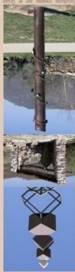
Esculturas creadas por el Grupo Munei para la senda del escultor Ursi, que pueden ser vistas a lo largo del itinerario.