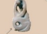
Algunas de las esculturas que se pueden ver en el tramo de Valle de Santullán