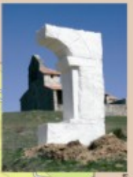
Esculturas del entorno de Villabellaco