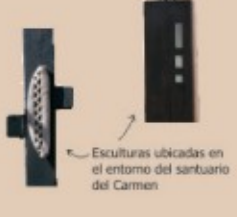
Esculturas ubicadas en el entorno del santuario del Carmen