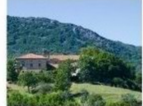
Arriba: el rebollo es la especie dominante en los bosques que atraviesa la ruta. Centro: vista desde el mirador de Rulaya. Abajo: el santuario del Carmen fue fundado en el siglo XVII; es un importante lugar de devoción que atrae fieles de dentro y fuera de la comarca.