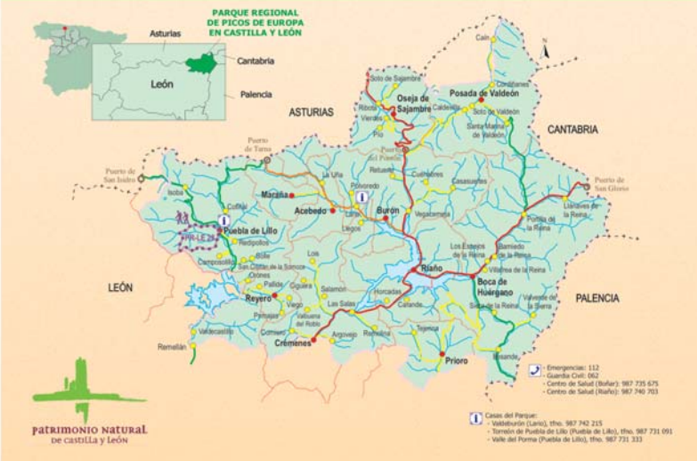
patrimonio natural de Castilla y León