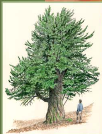
Un corto desvío nos lleva al monte de La Cervatina, donde existe un magnífico bosque de tejos, con algunos ejemplares de tronco extraordinariamente grueso y hasta 1.0 m de altura.