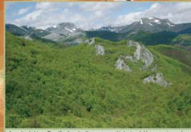
A partir de Vega Terrillo, la ruta discurre por el interior del bosque; tan solo en los cambios de vertiente se disfruta de panorámicas amplias que permiten contemplar frondosas cabeceras escoltadas por sucesiones de montañas y crestones calizos.