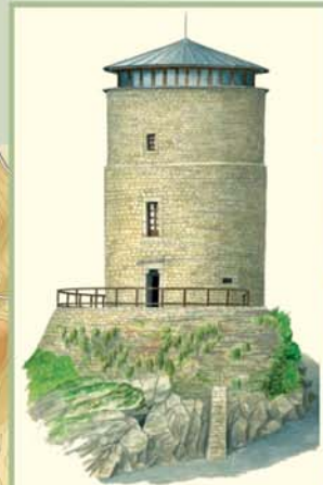
En la vieja torre medieval, se puede visitar la Casa del Parque del Torredón de Puebla de Lillo, donde se muestra una interesante exposición sobre el espacio protegido.