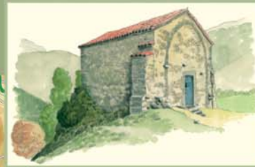
En la ermita de Pagarás se ofician algunas misas al año, pero ya no se acostumbra a celebrar la romería, con comida campestre incluida, que solía organizar antaño la parroquia de Lillo.