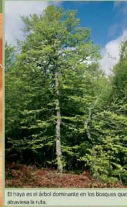
El haya es el árbol dominante en los bosques que atraviesa la ruta.