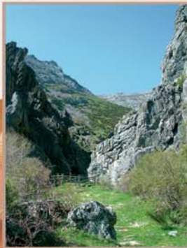
La Hoz de la Cabrera servía de entrada al puerto pirenaico del mismo nombre, cuyos pastizales, después de varios años sin recibir la visita de los rebaños trashumantes, han desaparecido bajo un manto de brezos y piornos.