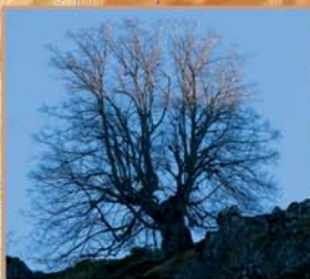
Colgados de las fuertes pendientes de Sierra Pelada se pueden distinguir tres tilos de gran porte. Entre ellos se cuenta el llamado Tilarón de Castro Velloso, un árbol viejo y notable, de tronco grueso y retorcido pero cuyas ramas principales miran rectas al cielo.