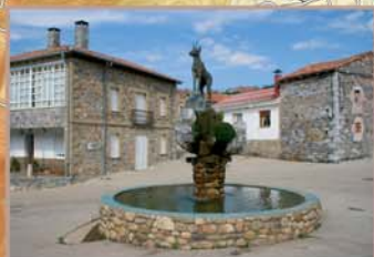
La plaza de Redipollos se organiza en torno a un abrevadero presidido por la escultura de un rebecco. Pegada a una de las fachadas que miran a esta plaza hay una fuente para llenar la cantimplora.