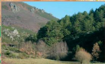
En el paraje de Los Ponticos se localiza un pinar que los expertos consideran autóctono, aunque hoy se prolonga por toda la umbria colindante gracias a repoblaciones efectuadas en las últimas décadas.