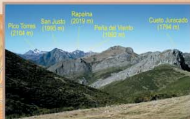
Hacia el norte, desde la Collada Ferosa se distinguen las principales cumbres del sector noroccidental del Parque Regional de Picos de Europa.