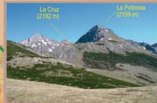
Sobre las amplias formas glaciares del Valle del Bustil de Pepe se levanta la cima más occidental del macizo de Mampodre: La Polinosa, por detrás, se distingue también la altura máxima del conjunto, la Peña de La Cruz.