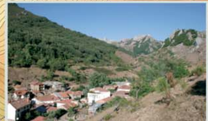
Desde la pista de La Collada se contempla una magnífica panorámica de Argovejo rodeado de un agreste y montañoso entorno.