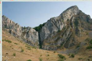
Desde la valleja de Valdepiño se contempla una fantástica panorámica del Pico Aguasalio sobresaliendo por encima de una espectacular pared de caliza cortada perpendicularmente por la hendidura del Pílon.