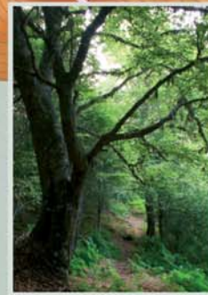
El hayedo de las Barriaticas es un bosque silencioso y umbrío de árboles cubiertos de líquenes y sotobosque tapizado de helechos.