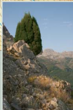
En los afloramientos de caliza de la Sierra los Frailes crecen dispersos algunos ejemplares de sabina albar.