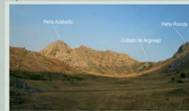
El puerto de Tejedo se extiende por una cabecera tan hermosa como inesperada, con grandes superficies de pasto rodeadas de montañas.